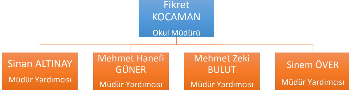
Şekil 1 Okul İdaresi